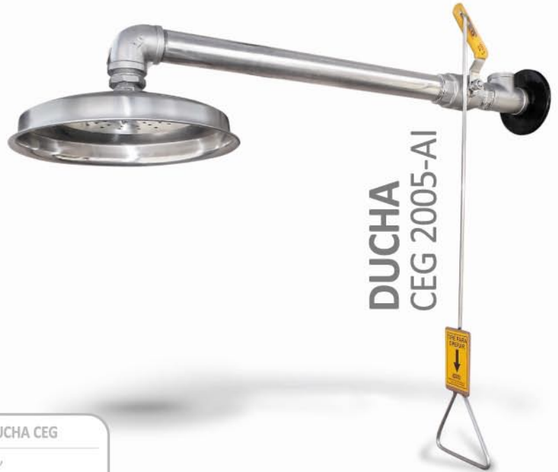
DUCHA CEG 2005-AI

Equipo fabricado según Norma ANSI Z 358.1 2004