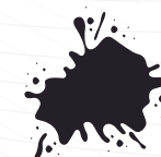
Resistente a salpicaduras

Pero eso no es todo, nuestro compromiso con la calidad se refleja en cada aspecto del traje. Utilizando materiales de primera calidad en su confección, aseguramos durabilidad y comodidad incomparables. Además, esta cinta reflectiva no solo es excepcional en visibilidad, sino que también resiste el desgaste y el paso del tiempo, brindando una protección confiable en todo momento.