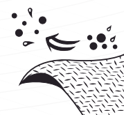
Resistente a partículas