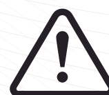
NO USAR EN EXPOSICIÓN A ALTAS TEMPERATURAS