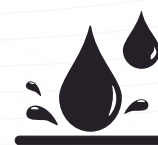
Resistente a líquidos