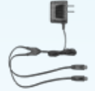
1 adaptador de carga con cable Y y doble conector Micro-USB